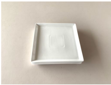
角皿 4枚 20cm×20cm