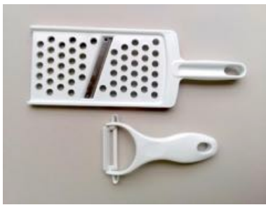
おろしカッター、ピーラー