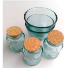
ガラス瓶、ガラスボウル