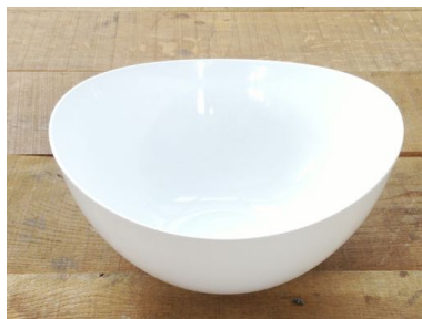
プラスチックボウル 横25cm

中 直径19cm(2個/深さ約7cm) | 小 直径16cm(深さ約6cm) | 深型 直径23cm(深さ12.5cm)