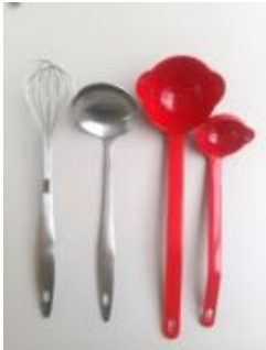
泡立て器、レードル