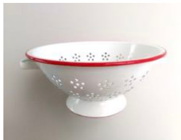
ホーローコランダー