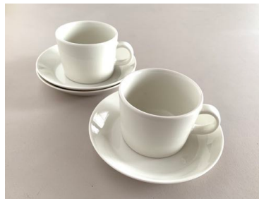
コーヒーカップ2客、ソーサー3枚 (ittala/ 14cm)