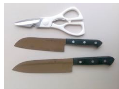
キッチンばさみ、包丁