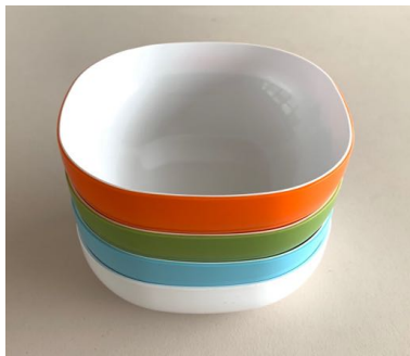
カラーボウル 直径15.5cm 4つ (オレンジ、 緑、水色、白)