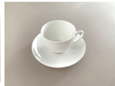
コーヒーカップ、ソーサー(15.5cm)