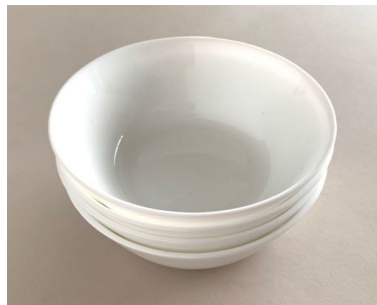
ボウル 小4個 直径14.5cm 深さ5cm