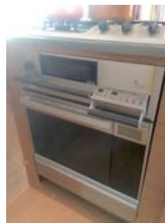
ガスコンロ、オープンレンジ レンジ600w