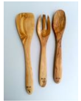
木べら、サラダサーバー

サラダサーバー、木べら、菜箸 長さ30cm前後。中央木べら2点ARTE LEGNO