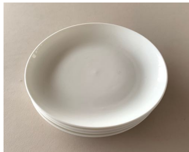
白丸皿 フラット4枚 直径20.5cm