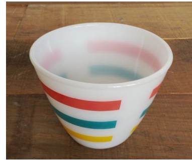
ガラスボウル 直径14cm