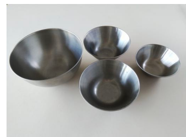
ステンレスボウル

中 直径19cm(2個/深さ約7cm) | 小 直径16cm(深さ約6cm) | 深型 直径23cm(深さ12.5cm)