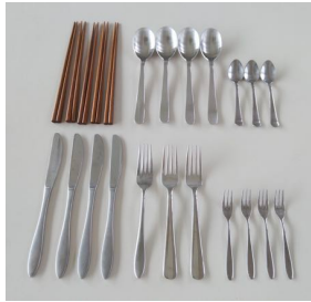
カトラリーセット

スプーン小 4本 | フォーク小 4本 | スプーン 大 4本 | フォーク大 3本 | ナイフ 4本 | 箸 5 膳