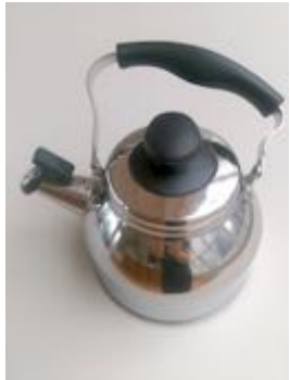
やかん | 容量1.8L 使用範囲1L