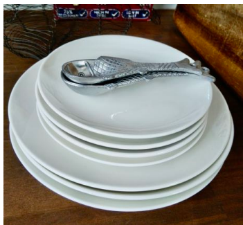
丸皿 小4枚 (15cm) 大3枚 (20.5cm) × ジャースプーン (魚) 2本