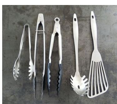
トンガ、スパゲティレードル、ターナー