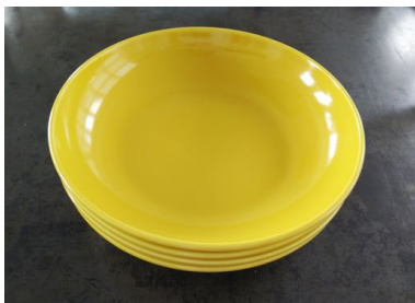
カレー皿 21cm 4枚