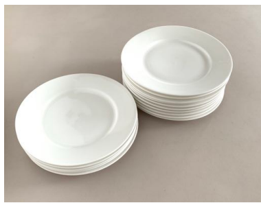
白丸皿 くぼみあり15枚 直径22cm