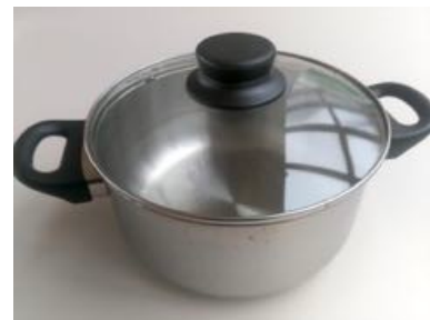
両手鍋 | 直径20.5cm深さ10cm

大 直径23.5cm(深さ8.6cm) | 中 直径19cm(2個/深さ約7cm) | 小 直径16cm(深さ約6cm)