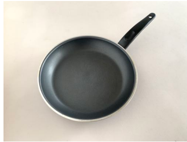
フライパン 大 直径 25.5cm 深さ 3.5cm